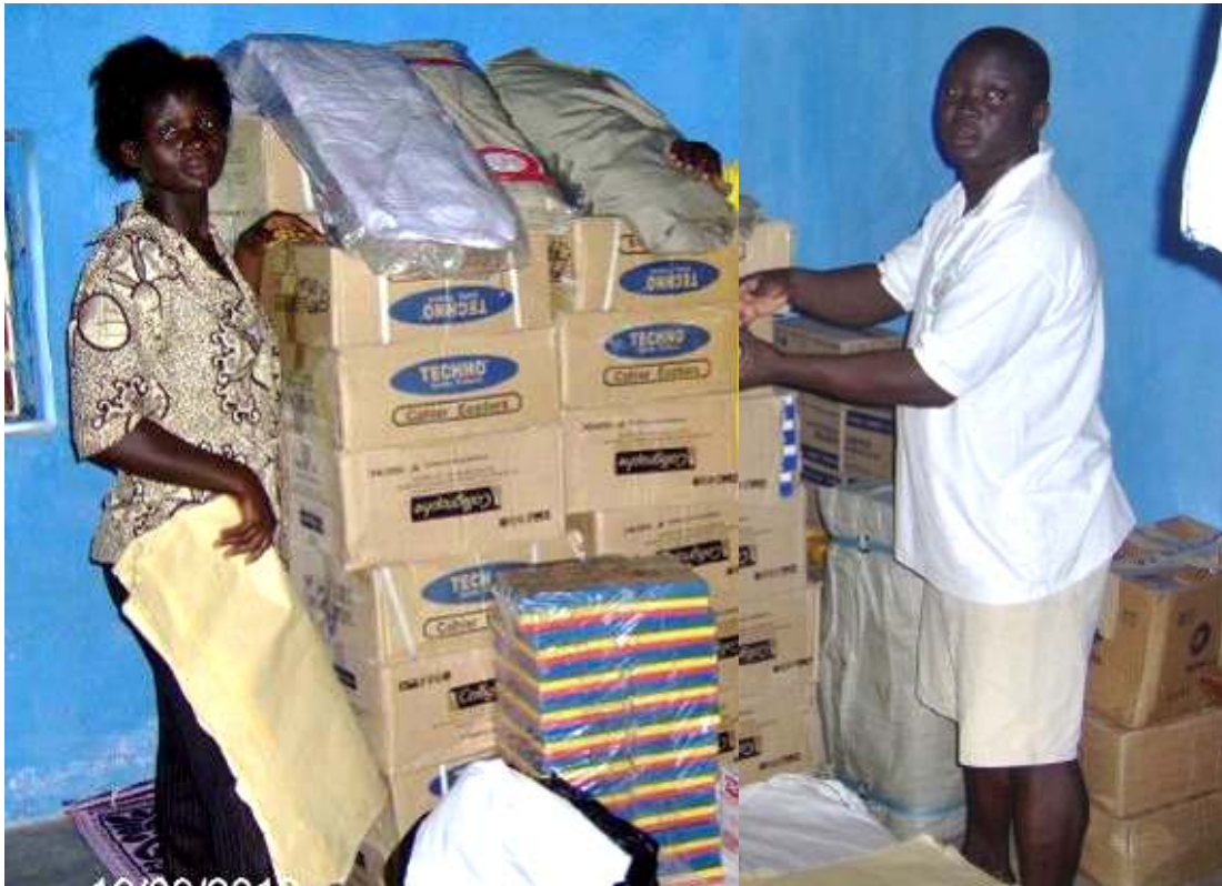
Les cartons des cahiers, bics, couvertures, etc. (19.09.2012) (Kartons mit Heften, Stiften, Umschlägen usw.)